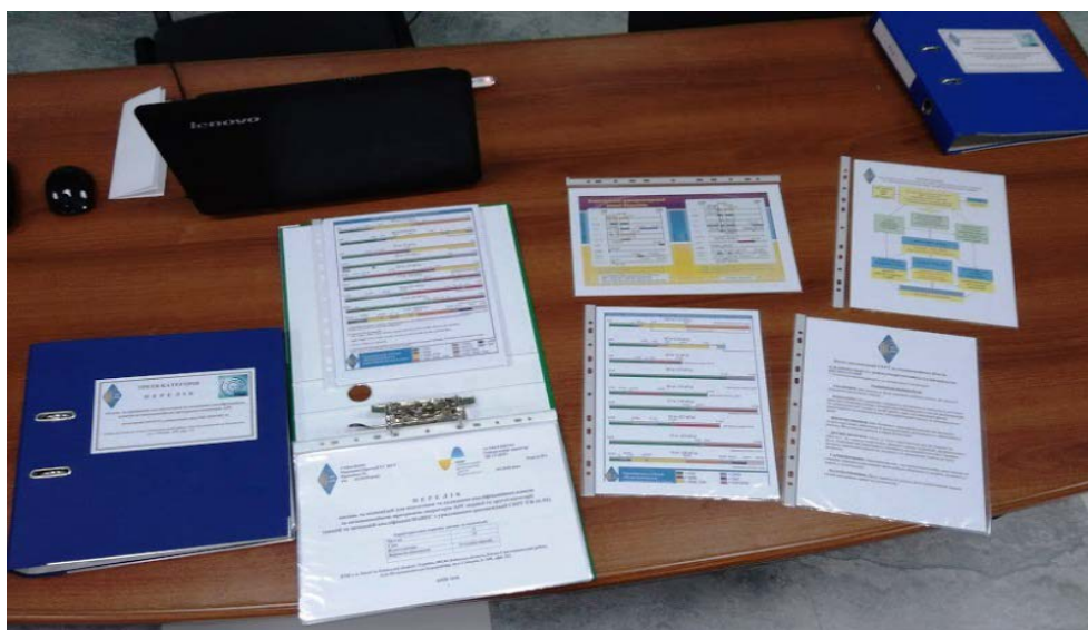
Фото 5. Частина матеріалів для підготовки операторів АРС першої та другої кваліфікаційної категорії