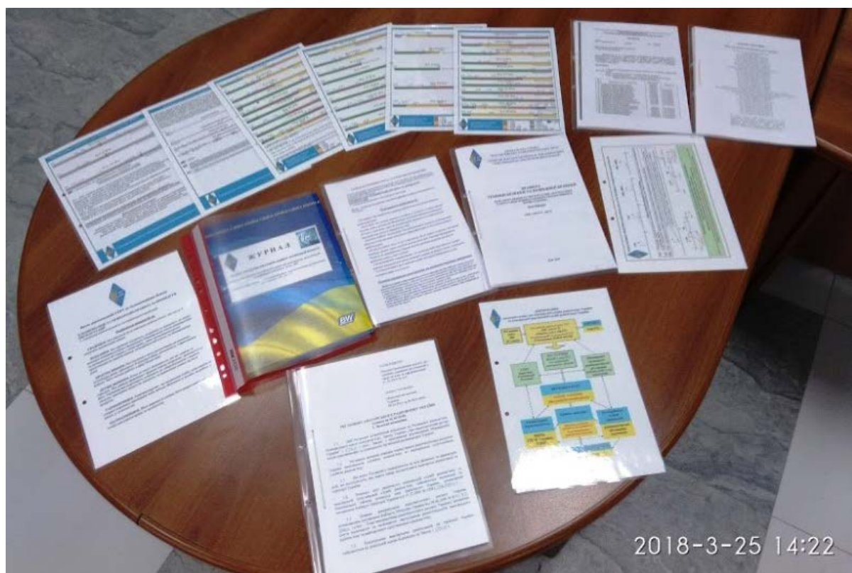
Фото 2. Матеріали для роботи КТК