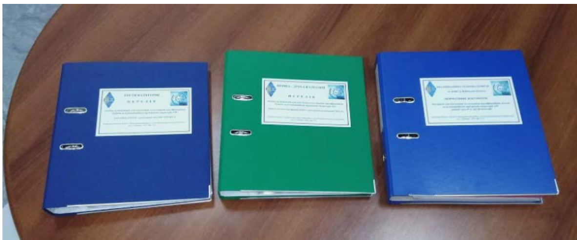
Фото 1. Три папки з матеріалами: а) для роботи КТК, б) для підготовки операторів АРС першої та другої категорії, в) для підготовки операторів АРС третьої категорії

25.03.2018 року в ШК ГС ВРЛ відбулося демонстрація для присутніх радіоаматорів напрацьованих матеріалів на паперових та електронних носіях.