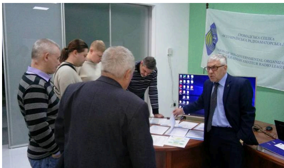
Фото 4. Обговорення матеріалів для роботи КТК