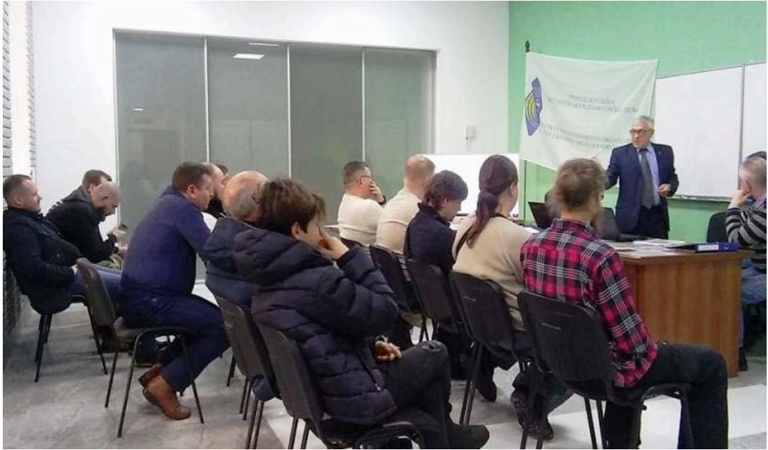
Фото 6. Робочі моменти обговорення матеріалів для підготовки операторів АРС певних кваліфікаційних категорій та здача іспитів

В ході обговорення та вивчення представлених матеріалів виявлений великий дисбаланс у процентному відношенні між кількістю запитань та кількістю вірних відповідей (критерії оцінки підтвердження знань):